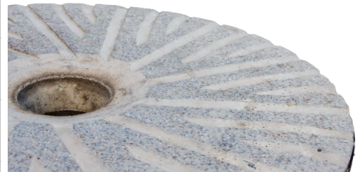
El corazón del molino